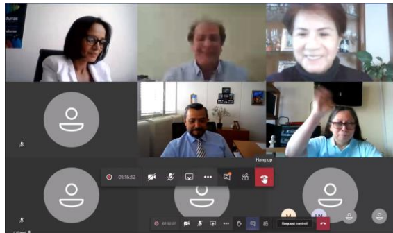
XXI Reunión Ordinaria del OCTA Agosto 2020