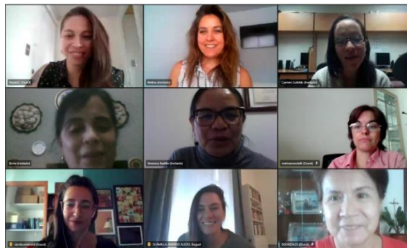
WiN ARCAL Septiembre 2020