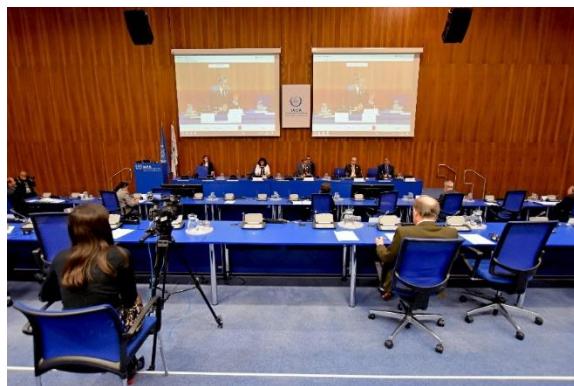
XXI Reunión ORA Septiembre 2020